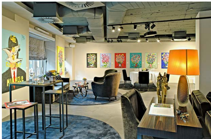
Die clubeigenen Räume mitten in Zürich bieten nicht nur für Mitglieder ein gediegenes und inspirierendes Ambiente.