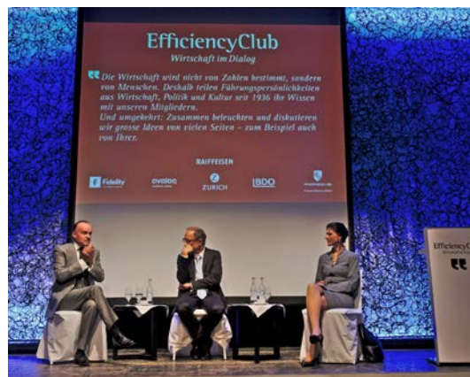
Volles Haus bei den Grossveranstaltungen, an denen prominente und kompetente Gäste zu Wort kommen, wie zum Beispiel der emeritierte deutsche Wirtschaftsprofessor Hans-Werner Sinn (links).