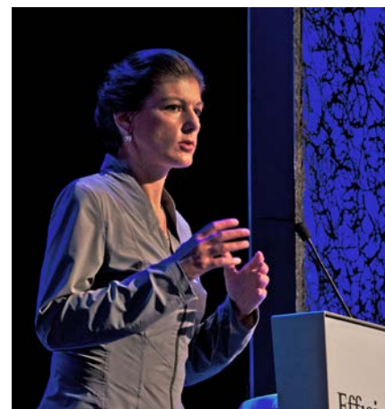
Sie alle waren bereits zu Gast beim Efficiency Club Zürich: Wladimir Klitschko (oben links), Joachim Gauck (oben rechts) sowie unten von links nach rechts: Jordi Mollà, Richard David Precht und Dr. Sarah Wagenknecht.

gesprachen hat, ist, dass der Efficiency Club Zürich äusserst aktiv ist und seine zahlreichen Veranstaltungen mit einem relativ bescheidenen Jahresbeitrag all jenen ermöglicht, die davon profitieren möchten. Das sei wichtig, so der Präsident. «Wir wollen kein elitärer Club sein, sondern möglichst allen Zugang zu unseren Treffen ermöglichen.» Als wichtigstes Element bezeichnen die Verantwortlichen dabei die sogenannten Erfahrungsgruppen, welche dem Erfahrungsaustausch im Rahmen bestimmter Problemkreise dienen. Auch hier soll alles möglichst unkompliziert laufen. Über die Aufnahme von Mitgliedern entscheiden die Gruppen autonom, einzige Voraussetzung ist die Mitgliedschaft im Club.